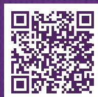
Ouvidoria do MPSC