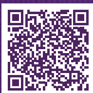
Lei Maria da Penha